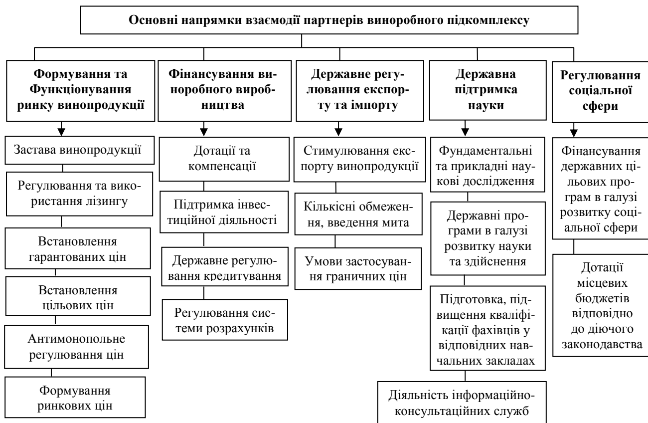
Рис. 1. Наукова схема-гіпотеза удосконалення взаємодії партнерів виноробного під комплексу*.

ном як створені економічні умови, так і внутрішньогалузеві проблеми економічних взаємин (рис. 1).